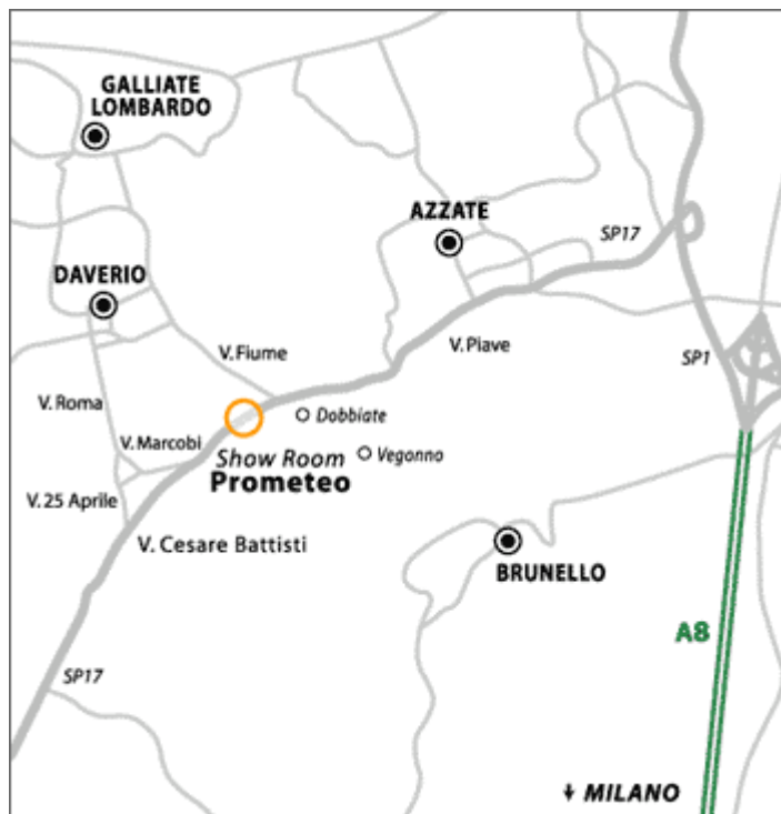
Mappa di Varese: uscita autostrada A8 e localizzazione di Daverio

Seguire a destra per Azzate Continuare per Daverio Dopo la prima rotonda di Daverio 50 metri sulla destra